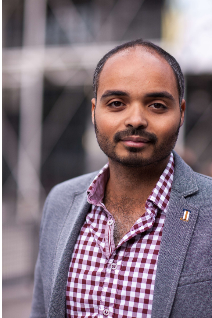
Figure 1

Théâtre René Panhard av. de la République 94320 Thiais