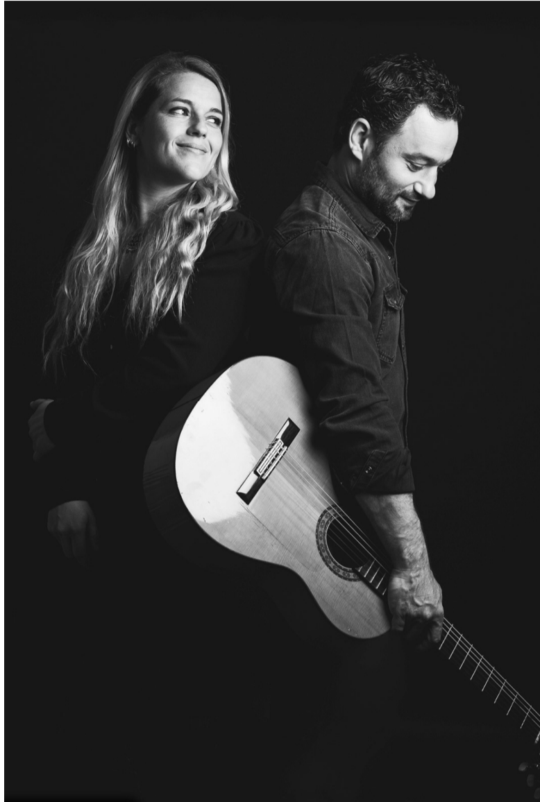
Figure 2

Café-théâtre 98 av. de Versailles 94320 Thiais